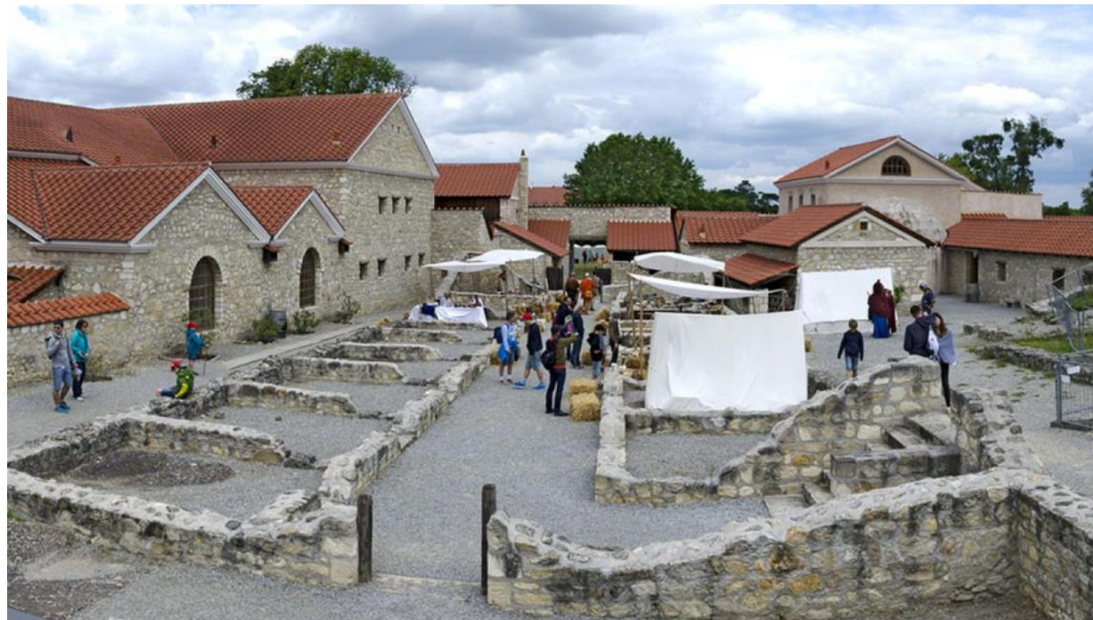
Sl. 4: Arheološki park Carnuntum