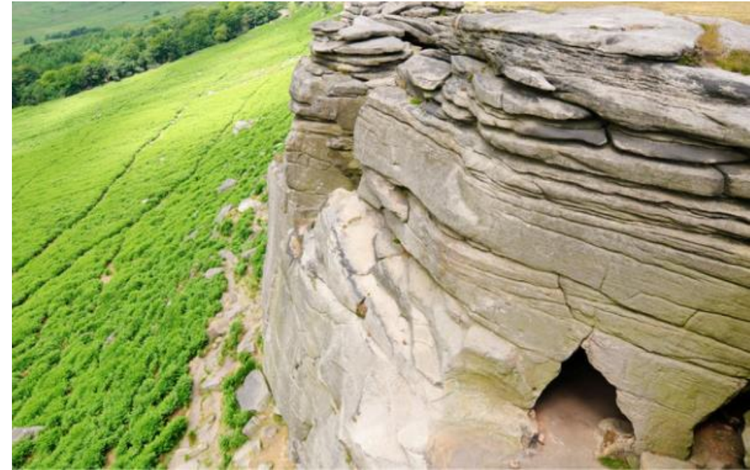
Sl. 10: Špilja Robin Hood - izlaz