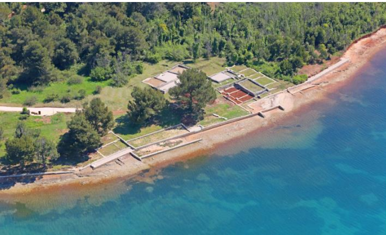
Sl. 1: Arheološki park Vižula