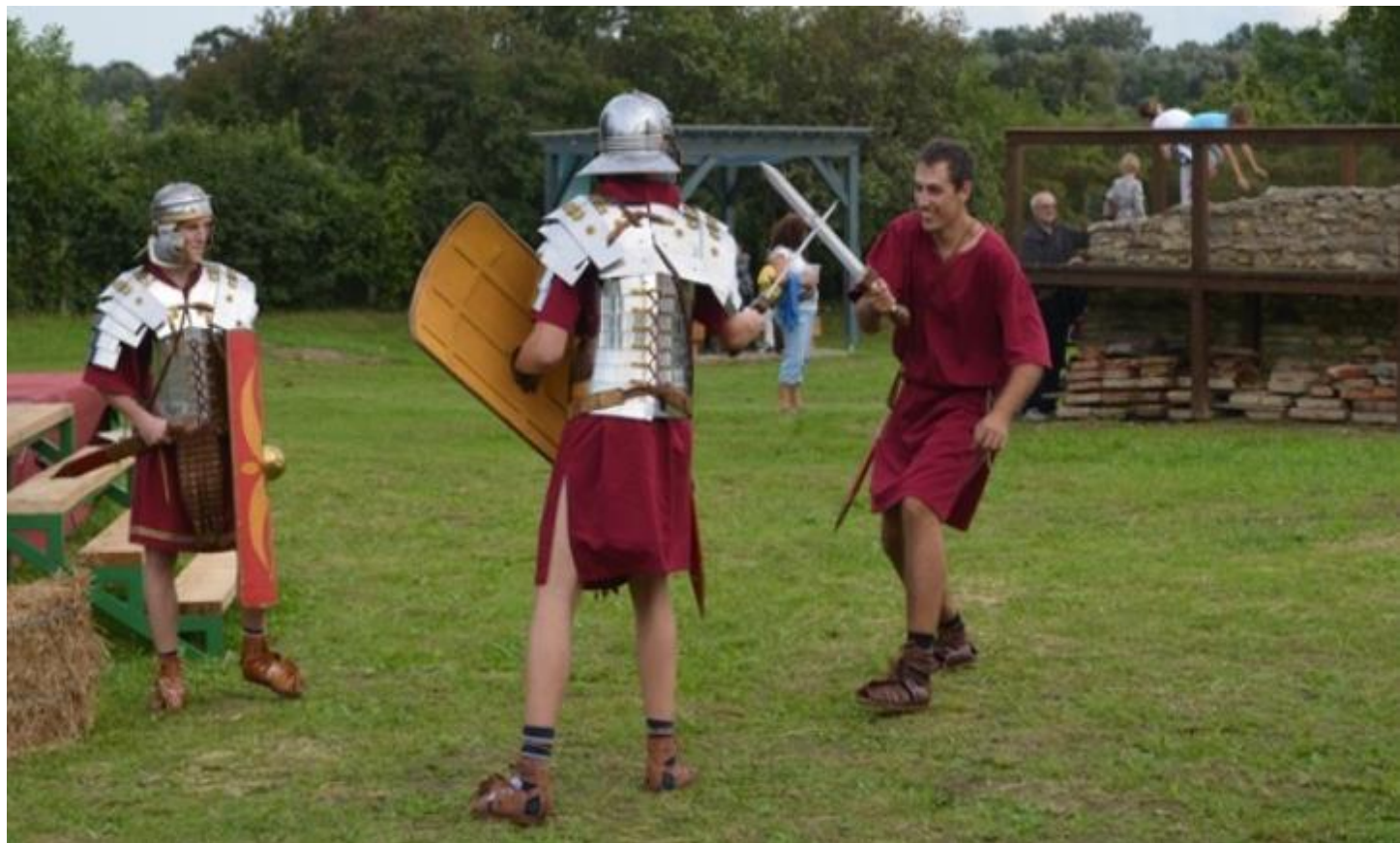
Sl. 3: Događaji u arheološkom parku Andautonija